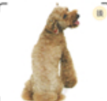
シッポは先々の短さを強調し、うさぎのようなコロとしたフォルムに。