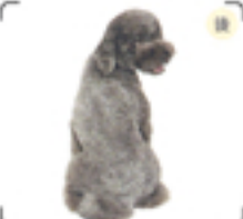
後ろから見たとき顔とシッポの2つの丸が重なるように可愛らしい。