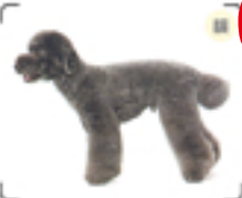
顔やシッポは強から見たときまん丸になるようにハサミで整える。