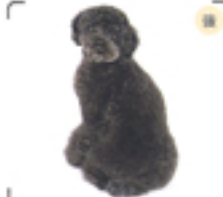
バックスタイルもいたってシンプル。お尻を強調している。