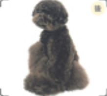
最もゴージャスに見えるのがバックスタイル。可愛さもバツグン。