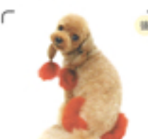
シッポの毛をふんわりと長め、カフの短さをカバーしている。