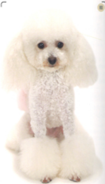
カラダの毛は短いが、顔と首周りの毛を長く多めに残したことで存在感をアピール。