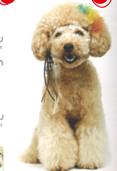
メッシュ部分はねじって巻きをつけて、色味がよくわかるようにスタイリング。インディアン風エクスタもおしゃれ！