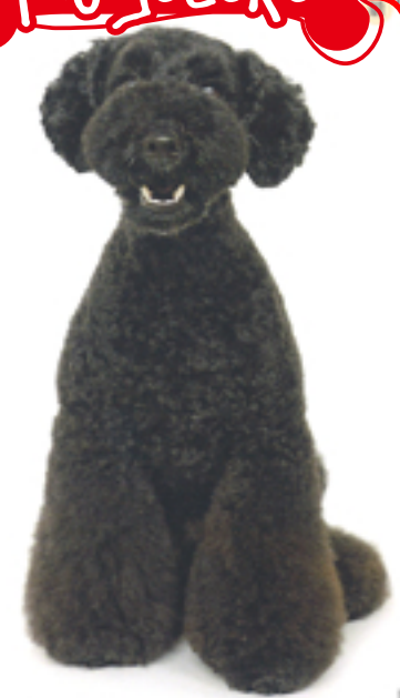
顔は小さくして首もすっきりさせ、顔はベルボム風にしてスタイルがよく見えるように、顔のまわりは短くカット。