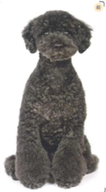
フロントは全体的に毛が短めに作られていてシンプルなお尻を丸める。顔はブーズカットを採用。