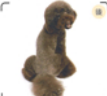
ボディはメリハリを加えて短くラインを出し、シッポを強調している。