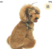
顔や脚のボリュームを強調するためのボディはバリカンで短めに切っている。