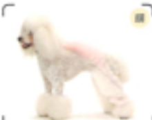
首周りと後ろ脚の太さを減らすことで動きをもたせている。