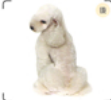
後ろから見ても脚の付け根がよくわかる。顔から首、目のラインもスムーズ。