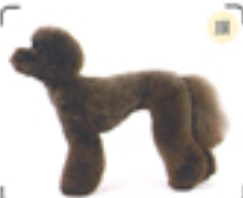
首の周まで毛いっぺんに短くして顔が引き締まる感じに仕上がっている。