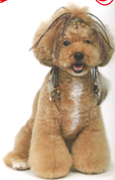
顔を大きく作っているため、顔もボリュームを強調するために全身のバランスがよくなるようにデザインされている。