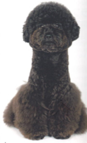
横から見たとき顔の大きさと脚の太さがとにかく目立つ。そのほか毛量の多いトイ・プードルならではの。