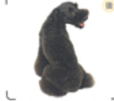
脚のボリュームやハートを際立たせるため、ボディはバリカンで短く。