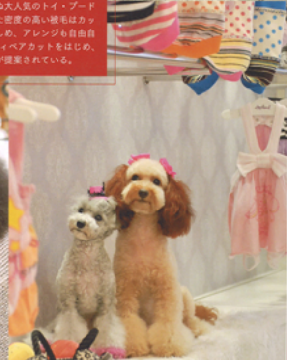
ブードルなら、どのカラーも可愛 (P.28)