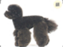
横から見ても前後50mmでそろえられた脚の太さがよく目立つ。