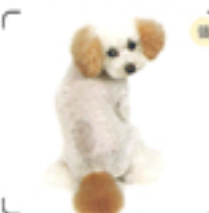
ボディは5mmのバリカンで短くしているので、耳とシッポが生える。