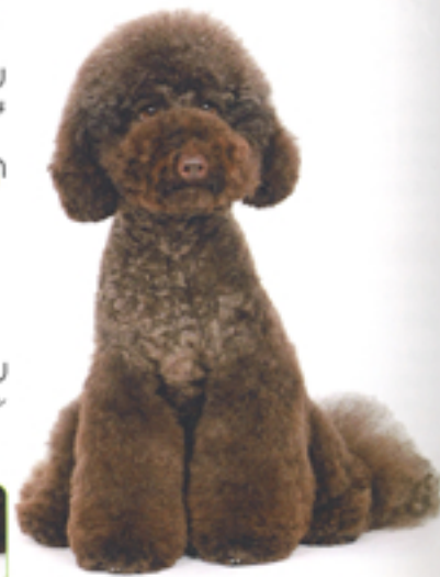
大きな顔に映らない太い脚が、ただの色物にならないように全体のバランスを整えている。