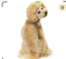
顔がふんわりなのでシッポも大きく作って全体のバランスをとる。