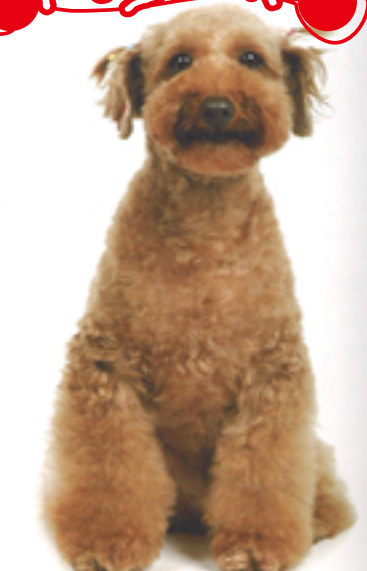
耳は内側の毛だけをバリカンで刈り顔面のみを際立たせることで、存在感を出している。