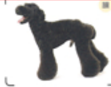
顔のハートが生産なので、シャッポは顔のまわりで短くして顔まわり。