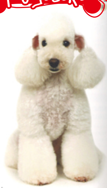
顔のまわりをすっきりさせることで顔が丸く可愛らしく見せる。目のラインは、丸さと可愛らしさを強調した小判型に。