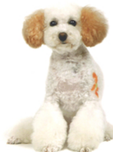
白いヘアはどうしても染みやけが気になるので、それをカバーするために首周りに1mmのバリカンを入れて顔元をすっきりと。