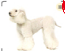
太くした脚に比べ、ボディは脚まですっきり短くカットしている。