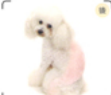
大きめの顔、そして無造作なカットで可愛さをアップ。