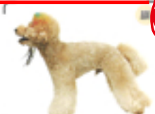
ボディに対して顔をはんなりさせるメリハリが効いた良シルエットに。