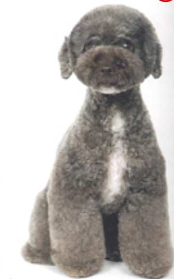
ボディはすっきり短くし顔にボリュームをつけると、顔と首のときのバランスがよく顔の後ろのお手入れも楽チン。