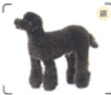
顔から見ると、お尻にパンツをはいているのがよくわかる。