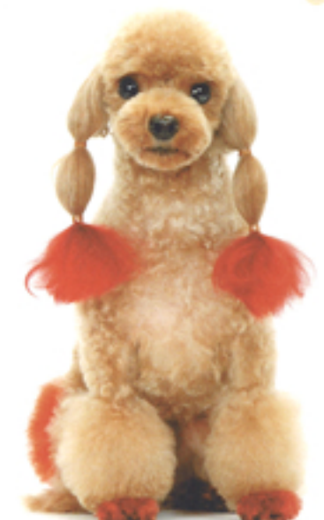
正面から見た際に顔が小さくならず、すっきり見えるように耳は2つ削りを採用している。