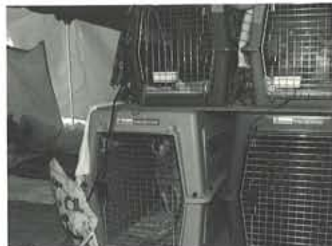
保護所の中に並べられたクレートの中で、飼い主が迎えに来るのをじっと待つペットたち

水、フードは1週間分程度用意し、携帯用食器と共にいつでも持ち出せるように準備。常用している薬がある犬は予備の薬を1週間分程度持とう。また避難時には連絡先や体の特徴、健康状態、かかり付けの病院などを記したメモも愛犬の身につけておきたい。