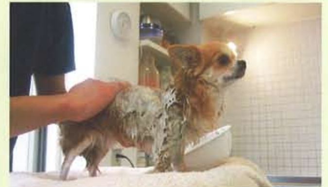
首から下を温めたオリジナルのクレイでしっかり覆われ、いよいよパックのスタート。