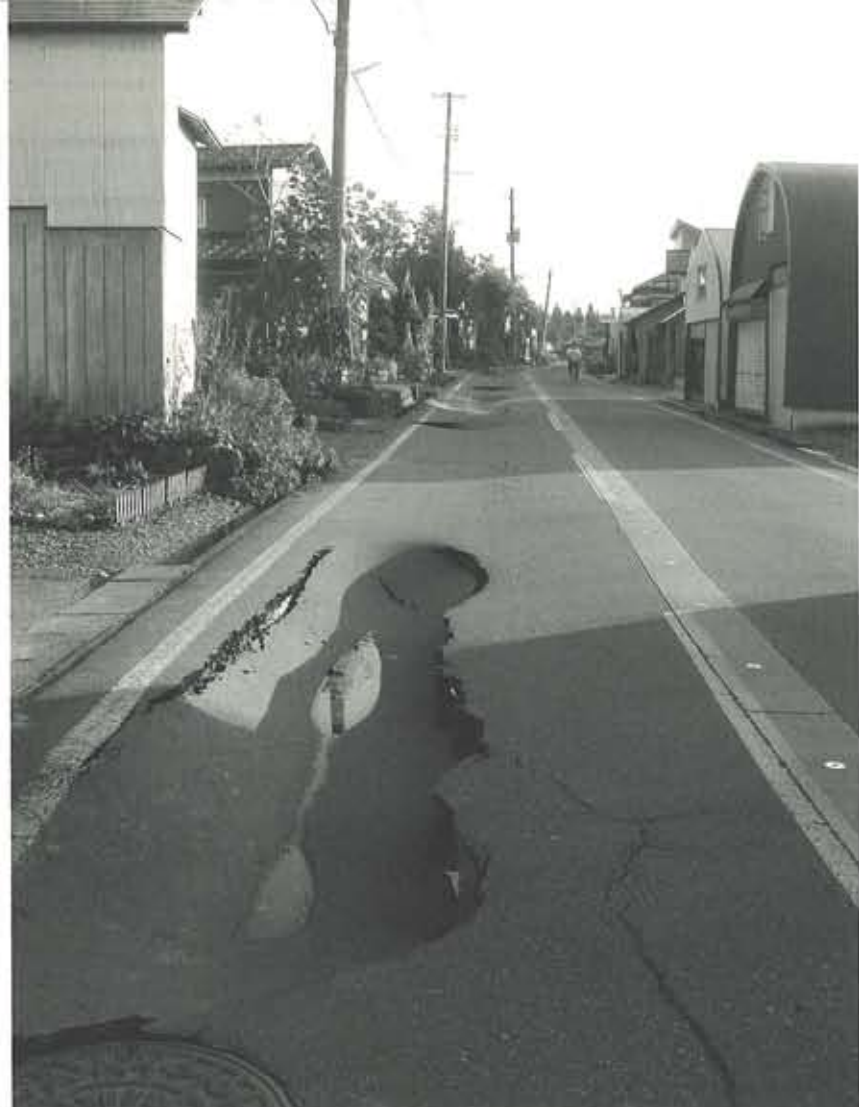
地震の際は道路のアスファルトが陥没し、穴や破片の散乱など犬には危険な状態になることも。十日町市にて