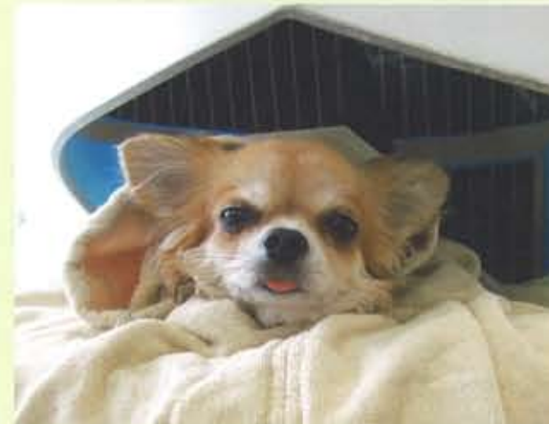
見て見て、この表情！ クレイパック中のチワワちゃんはこんなに幸せそう！