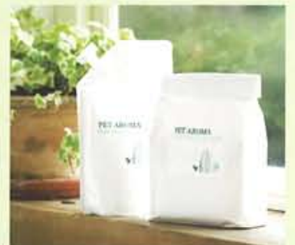
クレイパックはコースメニューにプラス¥2,520～。

愛犬にプレゼントしたい 極上のひととき 次に訪れたのは「D・O・G BUBBLES」。こちらではなんといつでもクレイパックが大人気。スタッフによれば、愛するわんちゃんのお誕生日に、プレゼントとしてクレイパックを受けに来る人が多いそう。それほどわんちゃんにとっては気持ちがいいものというところ。 クレイとは大地の粘土層から採れる粘土で、岩石が変化してできたもの。BUBBLESのクレイパックはその中でも最高級のフレンチクレイを使用しており、天然のミネラルをたっぷり含んでいるとのこと。このクレイを全身に塗って15分から30分ほどパックすると、皮膚や被毛の汚れや老廃物を取り除き、不足したミネラルを補って潤いを与えてくれるとか。 「それに血行を促進し、筋肉疲労を癒してくれるので、わんちゃんはみんなうっとりしますね。パック中の写真を見た飼い主さんは「こんなに気持ちよさそうなの！」と驚かれますよ」とスタッフ。確かにパック中のわんちゃんの幸せそうな表情を見ると、またプレゼントしてあげたくなるかも。 またこちらのもう一つのオススメが、わんちゃん用の美容液を使ったマッサージ。植物エキスをたっぷり使ったアロマジェルなので、マッサージの他にもお肌のトラブル予防や皮膚被毛の保湿にも効果あり。水溶性でさらっと馴染みやすく、べとつかないところも好評だそう。 人気サロンのさまざまな最新お手入れ法、今度の愛犬のお誕生日に試してみたいかが？