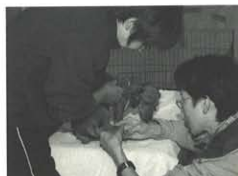
保護されている被災犬たちには、獣医師による定期検診を週に2回行い、健康面のチェックを怠らなかつた