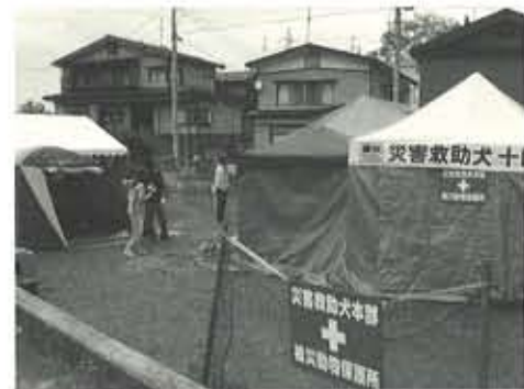
十日町市に設けられた災害犬のための保護所。ボランティアの人たちによる活動は約2か月続けられた