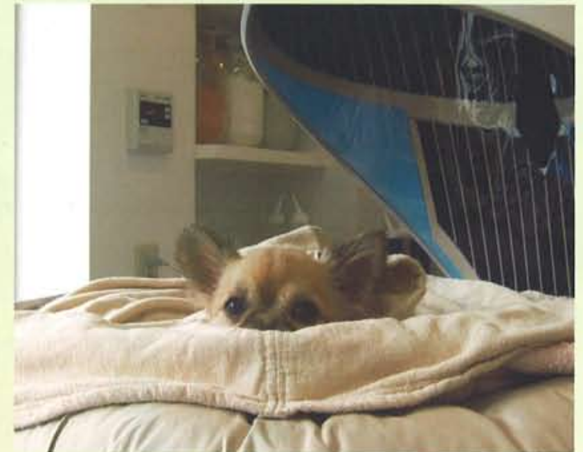
クレイパックを初体験！ クレイの上からバスローブに包まれ、遠赤外線が加温。もう眠くなっちゃった？