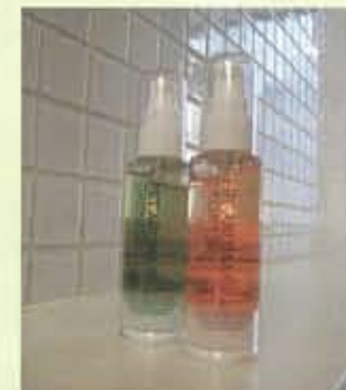
アロマジェル (50ml) ¥2,800