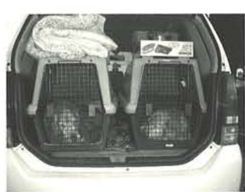
車内での避難生活が続き、クレートに入ったままの犬たち。クレートトレーニングは大切な災害対策の一つ