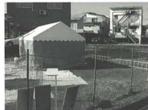
保護所の敷地内には備蓄テントも設置され、JKCやドッグフードメーカーなどからの支援物資が保存された。