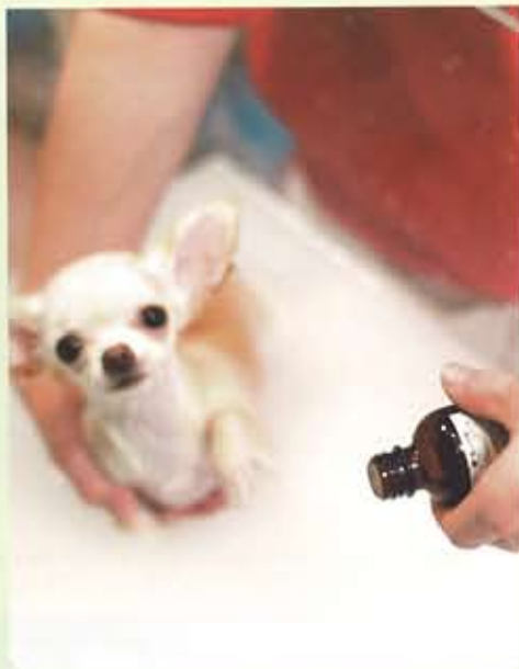
その日のそのコの状態に合わせたアロマオイルでさらに効果がアップ。