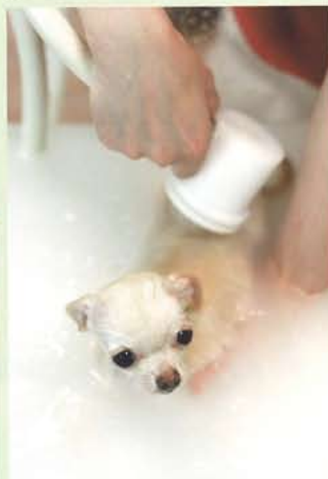
目の周りはやさしくお手入れ。リラックスのあまり寝てしまうコも多いとか。