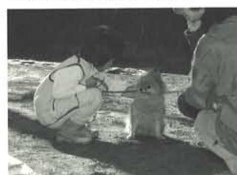
「早く一緒に暮らしたいね」と飼い主家族。保護犬と飼い主の面会は、他の犬への影響も考え保護所の外に限定