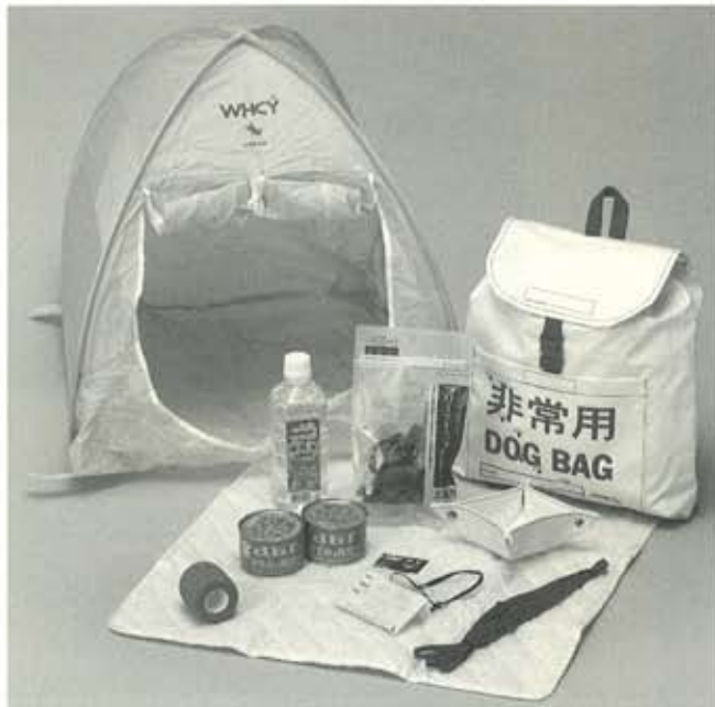
用意しておきたい愛犬用非常持ち出し袋。中には緊急避難時に役立つ簡易折りたたみテントなど9アイテムが。防災教・9セット(for DOG) ¥15,750/ウォームハートカンパニー

前ページでも災害時に役立つグッズを紹介したが、犬用グッズを手がけるブランドやショップもさまざまな防災グッズを扱っている。とくに防災バッグは、内容にはそれぞれ違いがあるものの、リード&カラーや簡易テント、携帯用食器など、どれも非常時に必要となるアイテムが揃っており、素早く避難の準備ができる。 また迷子札やロケットなど愛犬の身元を知らせるためのグッズも必需品。「犬ごころ」ではQRコードを入れた迷子札もあり、携帯でコードを読み取れば連絡先などの情報を知ることができるようになってきている。個人情報情報のセキュリティを考えた、新しいかたちのIDタグだ。 災害への不安を軽減してくれる防災グッズのあれこれ。不測の被災に備えて、ぜひ身近に用意しておきたい。